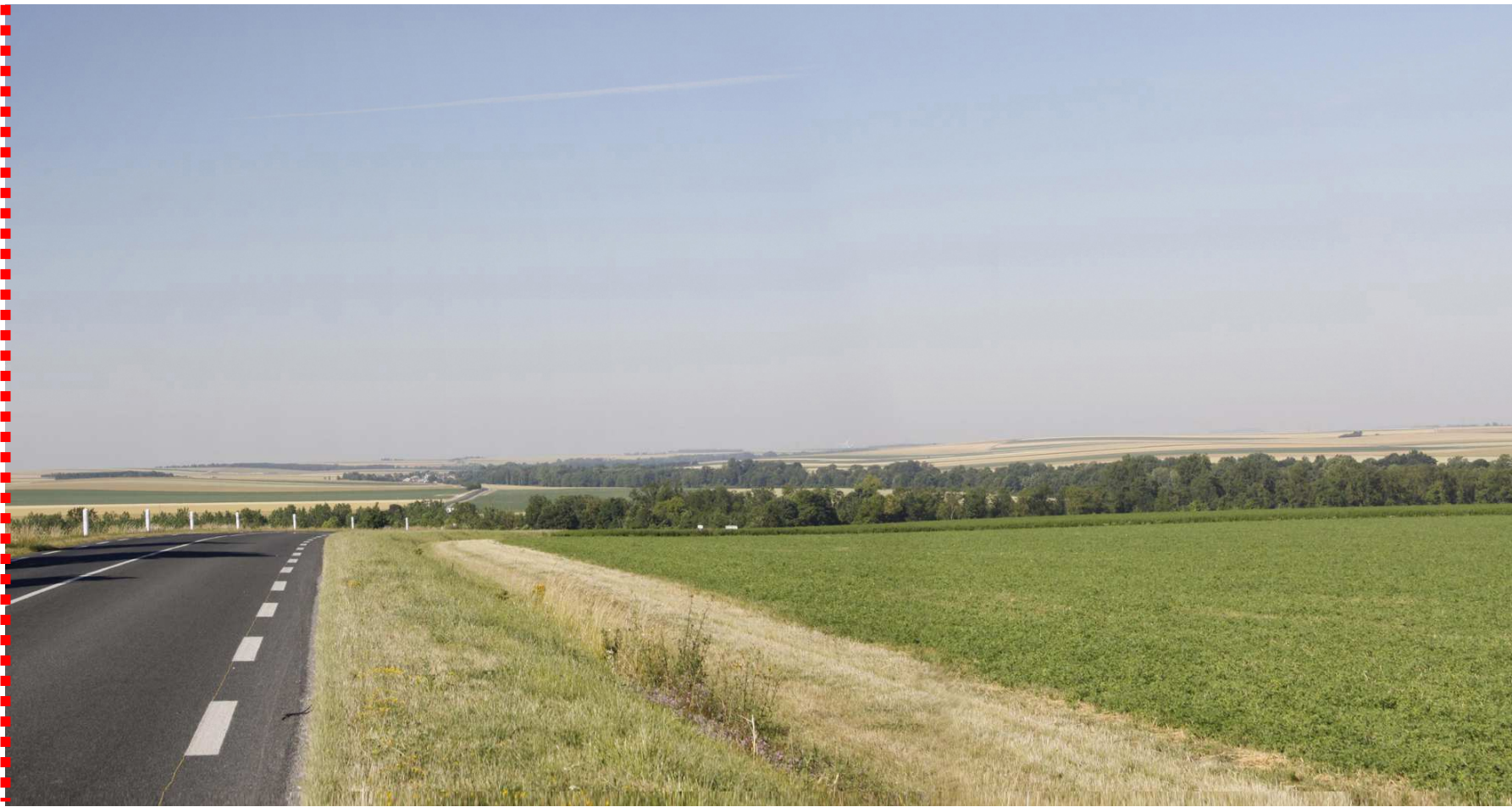
Photomontage recadré à 60°