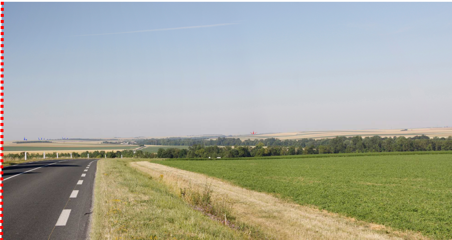
Photomontage d'interprétation recadré à 60°